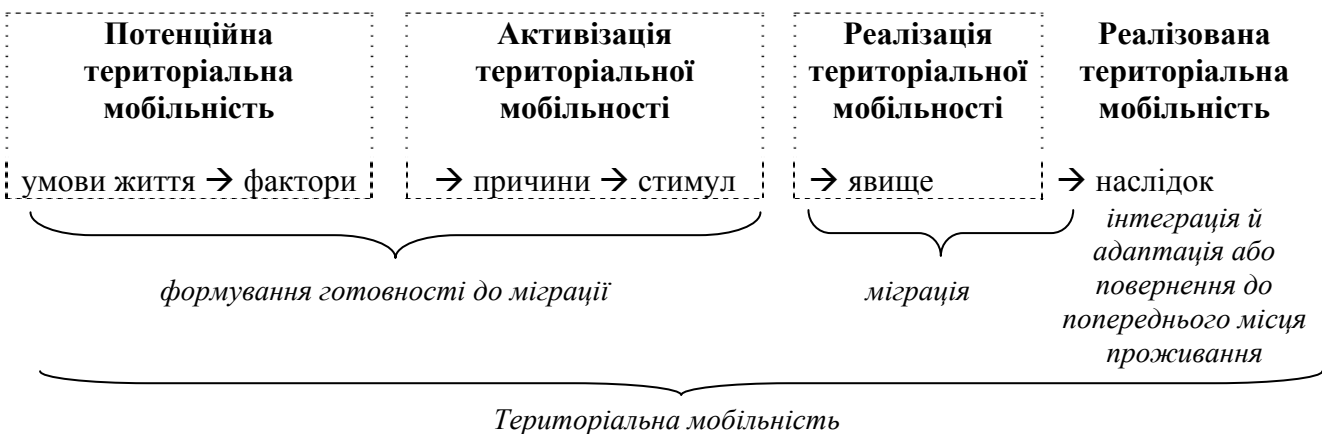
Рис. 1. Модель реалізації територіальної мобільності молоді

Виявлення стадій територіальної мобільності, послідовності ухвалення рішення молоддю про територіальне переміщення дало змогу сформувати модель реалізації територіальної мобільності молоді (рис. 1).