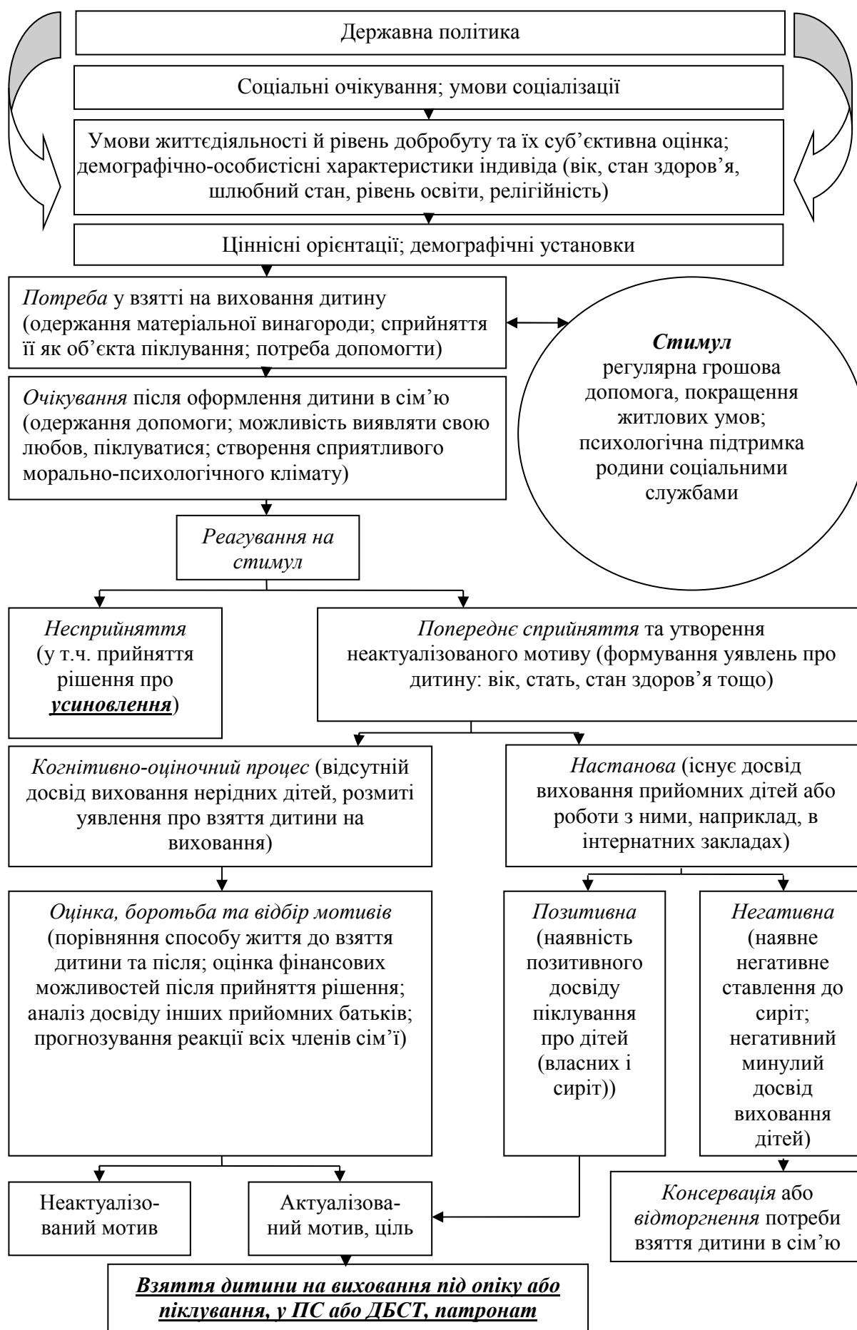
Рис. 3. Мотиваційна модель взяття соціальних сиріт на виховання