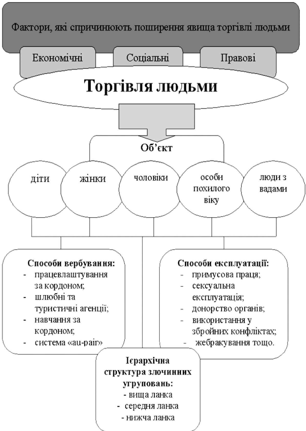
Рис. 1. Торгівля людьми як процес