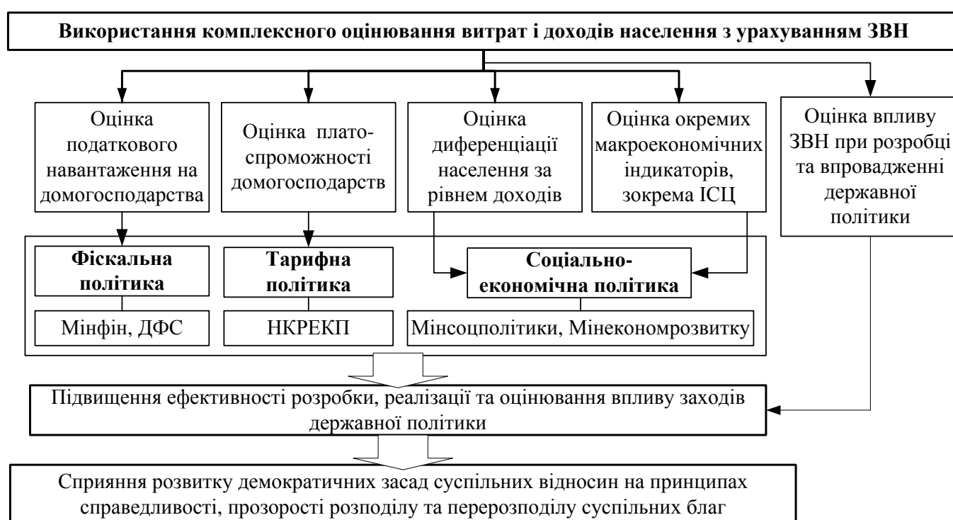
Рис. 3. Основні напрями використання комплексної оцінки показників рівня та умов життя населення України із більш повним урахуванням споживчих витрат і доходів його заможних верств

Комплексна оцінка рівня життя населення з урахуванням його заможних верств може бути використана у соціально-економічній, фіскальній і тарифній політиці (рис. 3). Зокрема, для підвищення ефективності розробки, реалізації, оцінювання впливу заходів тарифної політики в роботі досліджено та враховано вплив витрат ЗВН у ході оцінювання платоспроможності населення України при споживанні житлово-комунальних послуг.