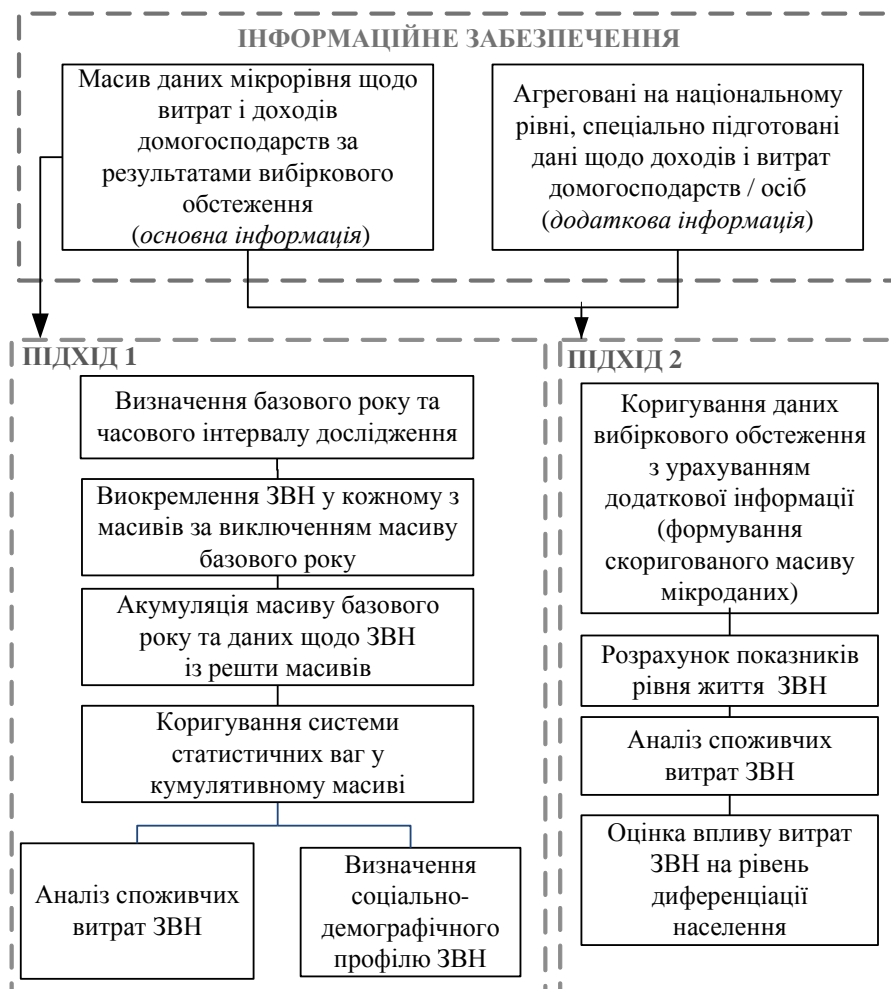
Рис. 1. Методологічні підходи до комплексного оцінювання соціально-демографічного профілю та споживчих витрат заможних верств населення

З метою визначення основних соціально-демографічних характеристик заможних верств населення, оцінки та аналізу витрат, здійснених ЗВН, доцільно застосувати перший підхід, суть якого полягає в побудові кумулятивного масиву даних мікрорівня шляхом об'єднання результатів вибіркового обстеження доходів та витрат домогосподарств (наприклад, ОУЖД) за декілька суміжних років із застосуванням процедур узгодження вартісних (грошових) показників для забезпечення їх зіставності в одному масиві (рис. 1).