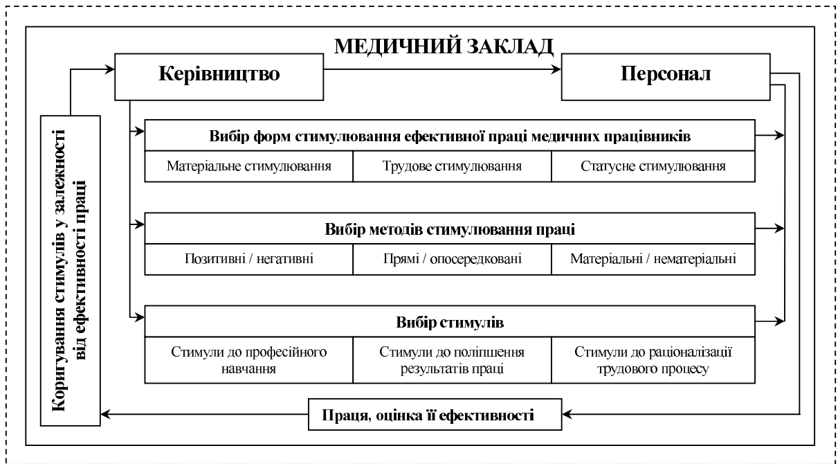
Рис. 1. Концептуальне бачення процесу стимулювання ефективної праці у медичному закладі

Систематизація зарубіжного досвіду відносно стимулювання ефективної праці у сфері охорони здоров'я засвідчила поширення практики комплексного залучення матеріальних та нематеріальних стимулів незалежно від домінування страхової чи бюджетної медицини. З'ясовано, що кінцева ефективність праці медичного персоналу у розвинених країнах визначається не стільки джерелами та обсягами фінансування охорони здоров'я, скільки підходами до організації та стимулювання праці медичних працівників на основі колективно-договірного регулювання. До найбільш поширених за кордоном методів заохочення медичних працівників до праці, крім заробітної плати, увійшли виплата премій, надання різного роду пільг та компенсацій, створення сприятливих умов для отримання додаткового доходу від приватної практики у післяробочий час, надання доступу до безперервної освіти, різноманітні статусні стимули. Водночас, порівняльний аналіз найбільш поширених у світі методів оплати праці медичного персоналу (гонорарного, подушного та фіксованого) показав, що жоден із них недосконалий, тому доцільно використовувати змішані моделі оплати праці.